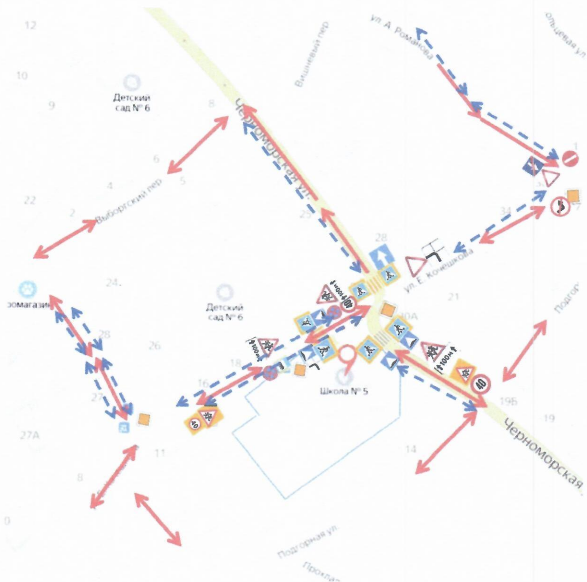
I. План-схема образовательной организации 1. Район расположения образовательной организации, пути движения транспортных средств и детей (обучающихся)